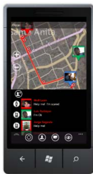
Figura 1. Servicios del Mapa y cálculo de ruta desplegados - Fuente Propia.

La ubicación de los miembros del grupo familiar se realiza mediante el uso de los servicios LocationServices (Ver Error! Reference source not found. ), para la ubicación de las personas. Estos servicios nos permiten indicar las coordenadas donde se encuentran todos los miembros de la familia y conocer la distancia que existe entre la posición del propietario del móvil donde se está ejecutando la aplicación y los miembros de su grupo familiar.