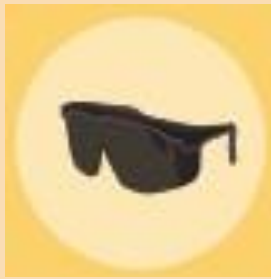
Lentes con protección UV