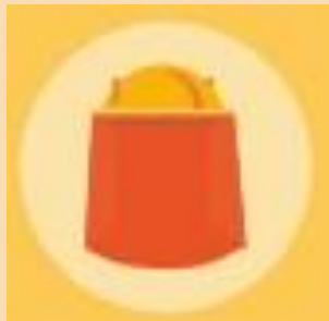
Casco con paño legionario