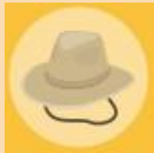
Sombrero de ala ancha