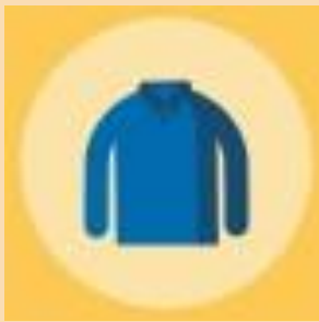
Polera manga largade trama